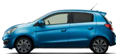
CERULEAN BLUE MICA (T69)