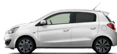
WHITE SOLID (W19)