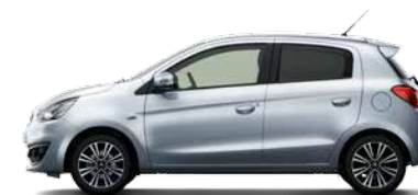
COOL SILVER METALLIC (A66)