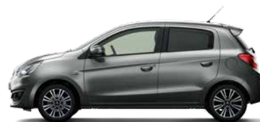
TITANIUM GREY METALLIC (U17)