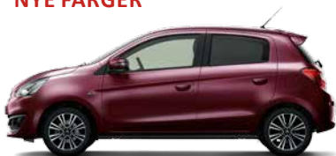
WINE RED PEARL (P57)