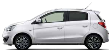
WHITE PEARL (W54)