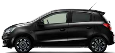
BLACK MICA (X08)