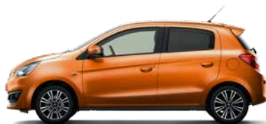
SUNRISE ORANGE METALLIC (M09)