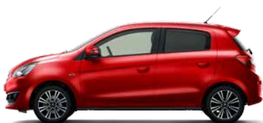
RED METALLIC (P19)